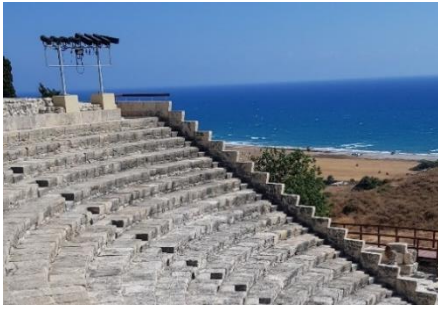
Slika 4: Primer slikovnega zgodovinskega vira za reševanje avtentične naloge