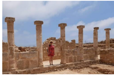
Slika 3: Učiteljica s terenskega raziskovanja med antičnimi ruševinami Paphosa