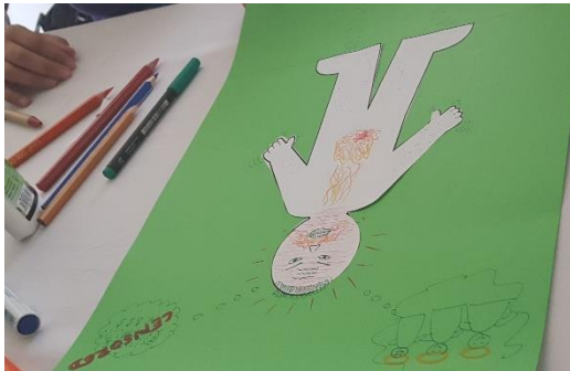
Slika 1: Učenci z vedenjskimi težavami naj izrazijo svoje občutke z risbo

posameznimi dogodki, katerih cilj je bil pomagati učencem voditi in sprejemati drug drugega. Del naloge je predstavljen na sliki 1. Drugi del naloge je bilo iskanje motivov na terenu, ki jih je bilo potrebno opremiti s pozitivnimi sporočili, ki učencem osmislijo šolsko delo in cilje v življenju. Za potrebe izvajanja te naloge so bili udeleženci seznanjeni tudi z osnovnimi načeli fotografiranja na terenu. Primer iz tovrstne naloge prikazuje slika 2, katere sporočilo je, da je potrebno v življenju slediti pozitivnim vrednotam in večkrat med poukom dati učencem pozitivna sporočila za življenje. Za osnovo je vzeta nekdanji obris Nikozije, glavnega mesta Cipra, s katerim so se udeleženci seznanili ob ogledu muzeja. Zanimive predstavitve tovrstnih nalog so potekale ob koncu spopolnjevanja.